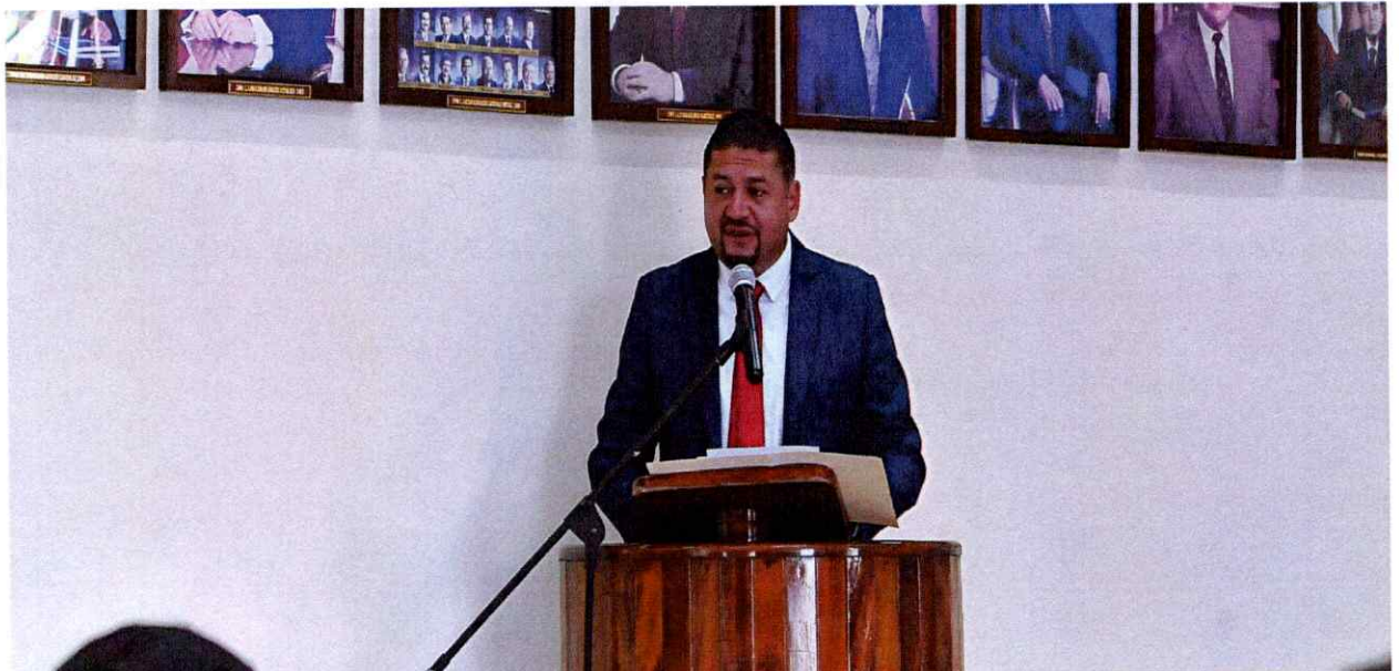
Sesión Solemne No. 36.