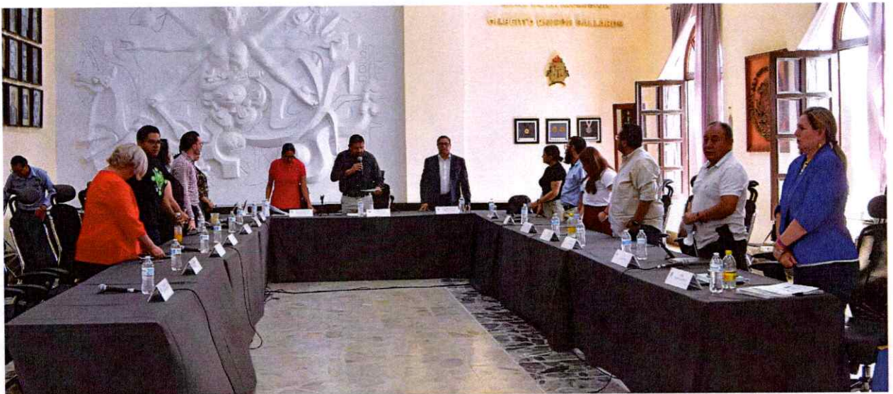
Extraordinaria No. 98.