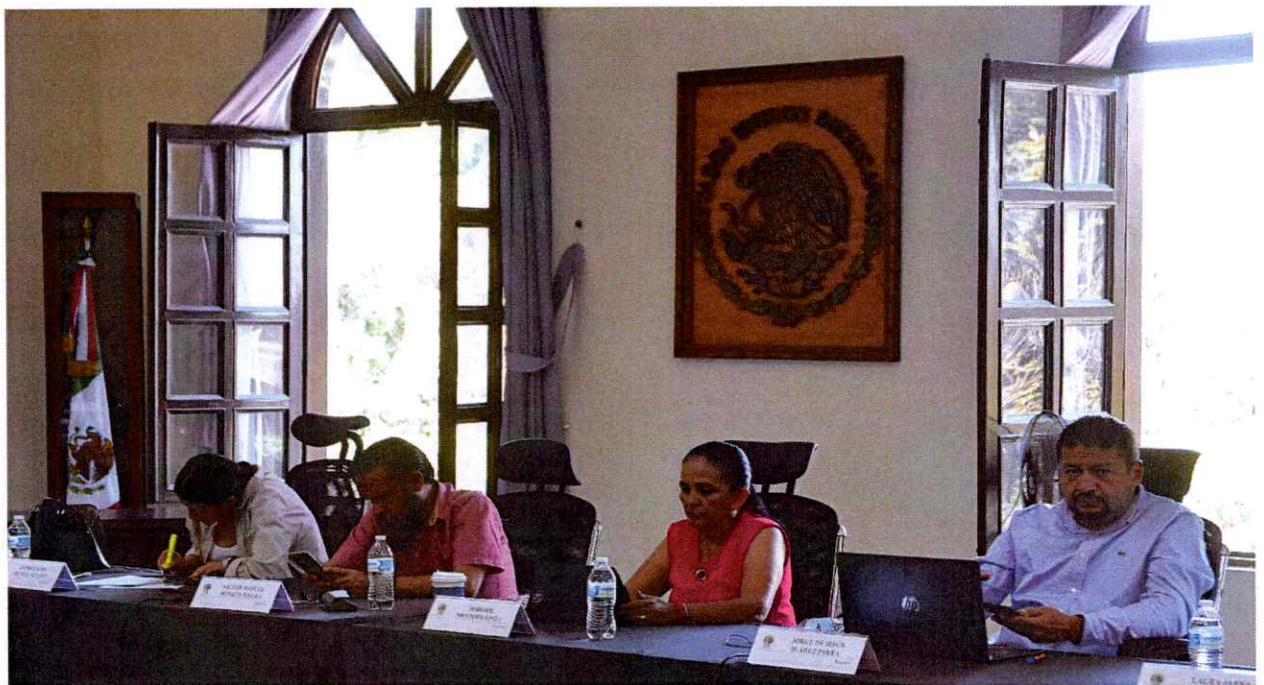
Extraordinaria No. 99.