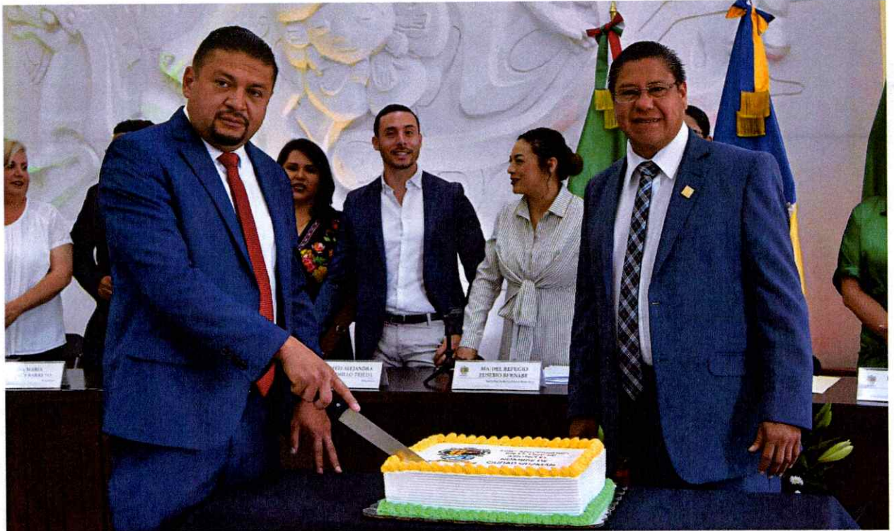
Sesión Solemne No. 36.

2024 Año del 85 Aniversario de la Escuela Secundaria Federal Benito Juárez