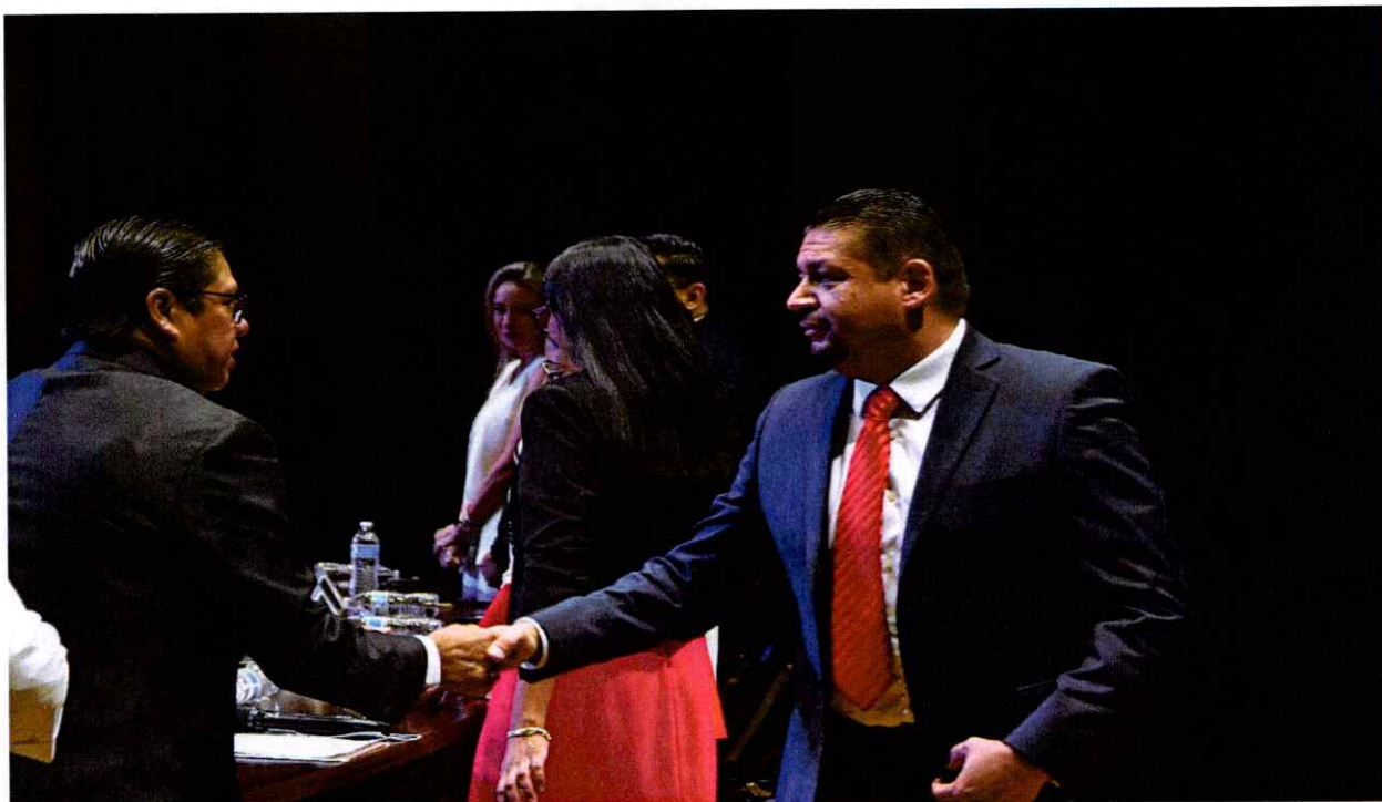
Sesión Solemne No. 37.