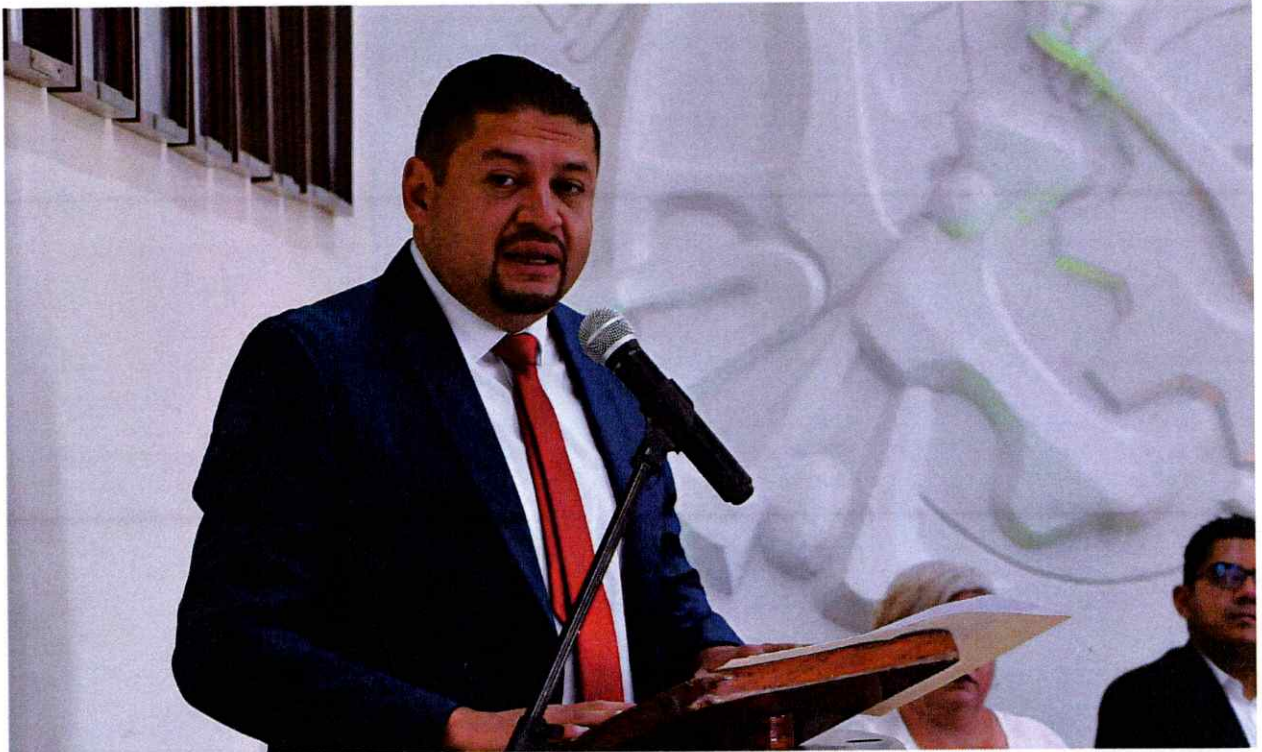
Sesión Solemne No. 36.