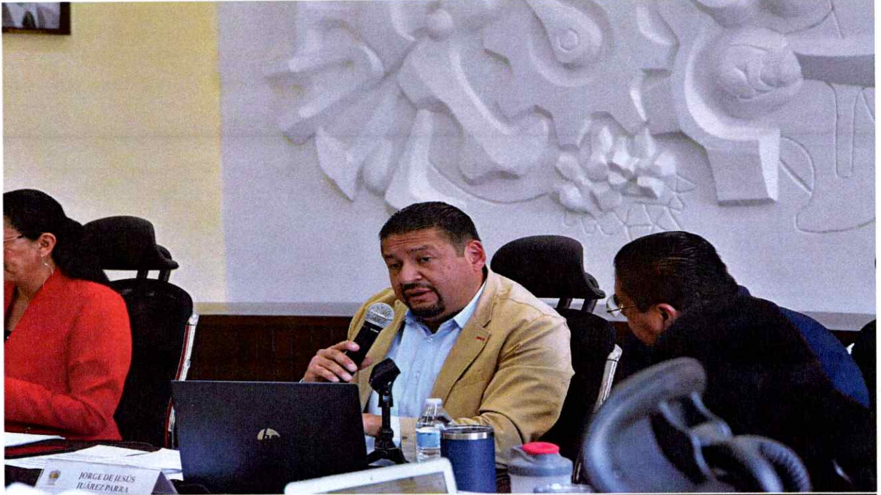
Sesión Ordinaria No. 49.

2024 Año del 85 Aniversario de la Escuela Secundaria Federal Benito Juárez