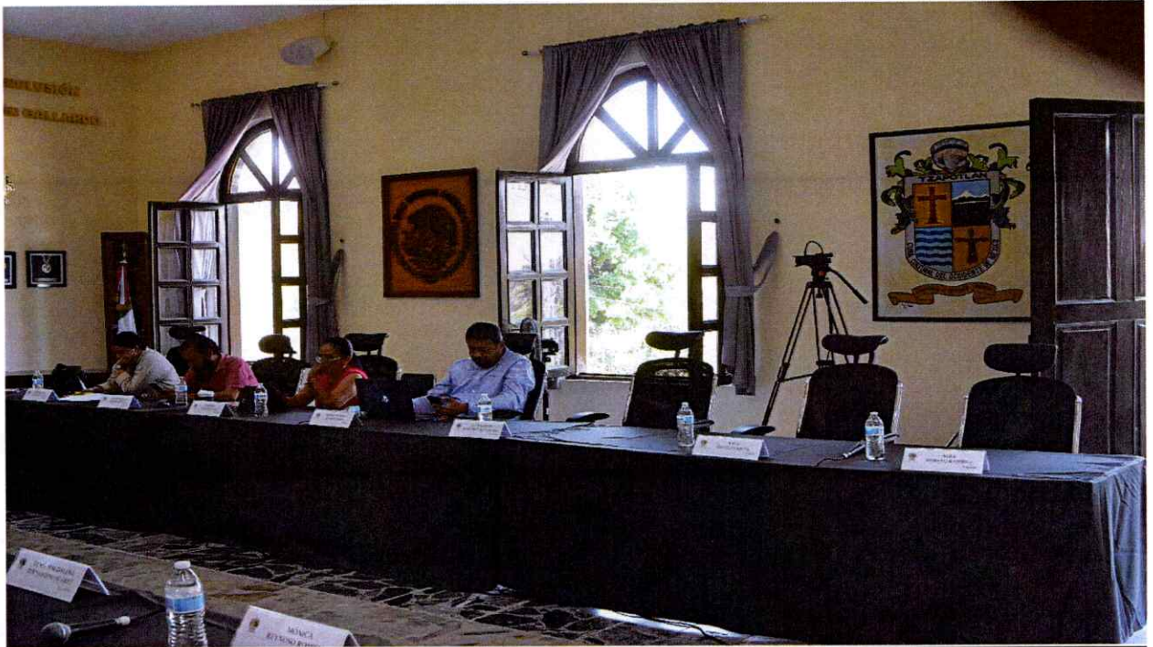
Extraordinaria No. 99.