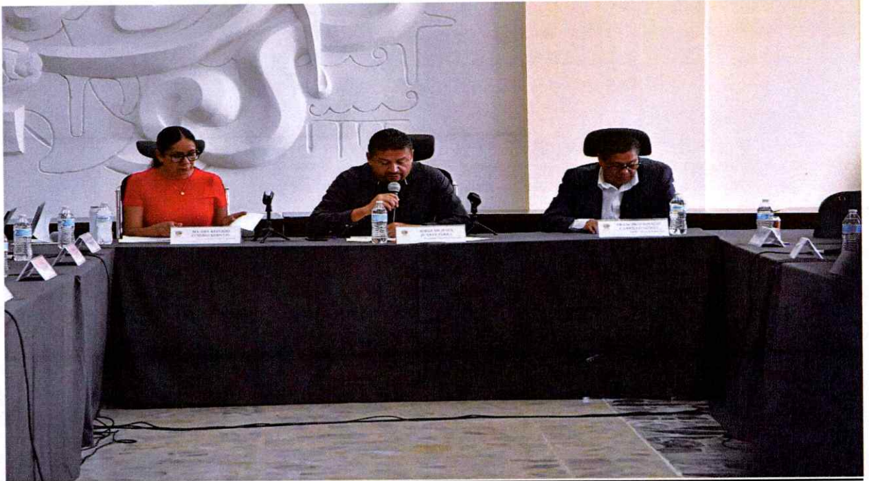
Sesión Extraordinaria No. 98.