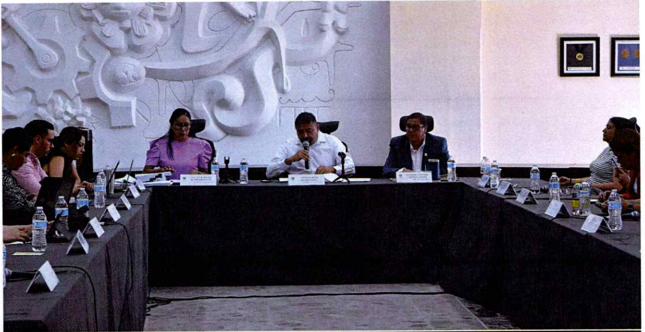
Sesión Extraordinaria No 95.