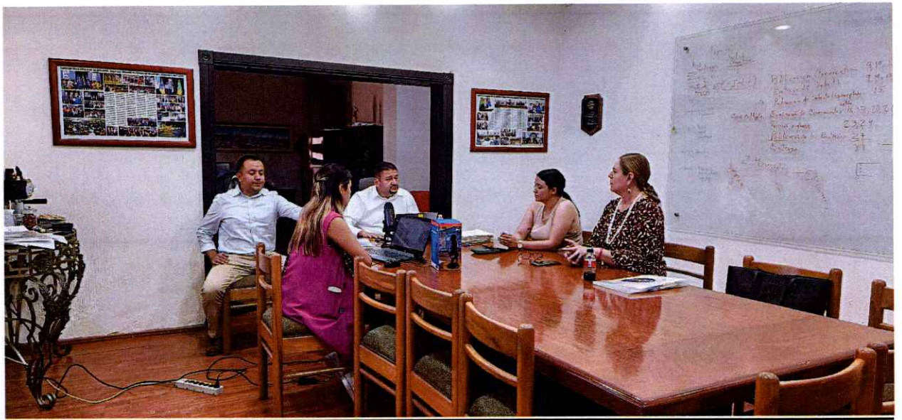
Sesión Ordinaria número 57. Comisión Edilicia Permanente de Espectáculos Públicos e Inspección y Vigilancia.