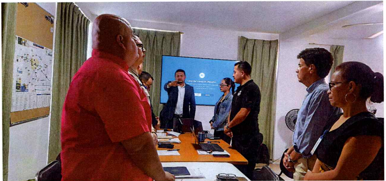
Sesión Ordinaria No. 09 de la Consejo Municipal de Seguridad Pública, Honor y Justicia. Toma de Protesta Titular.