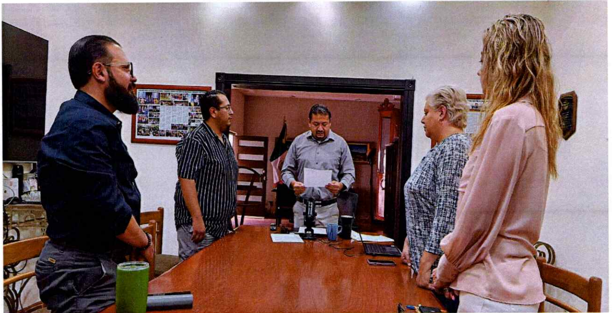
Sesión Extraordinaria de la Comisión Edilicia Permanente de Seguridad Pública y Prevención Social. Toma de Protesta.