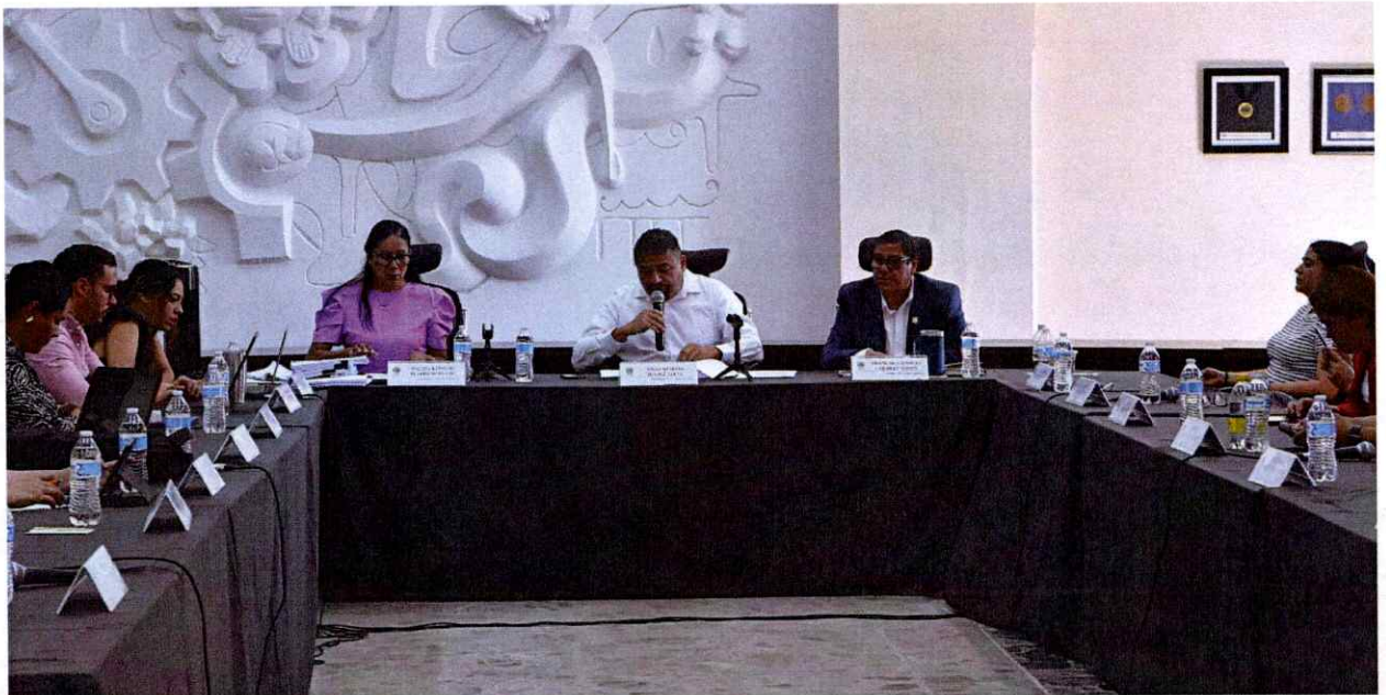
Sesión Extraordinaria No 95.