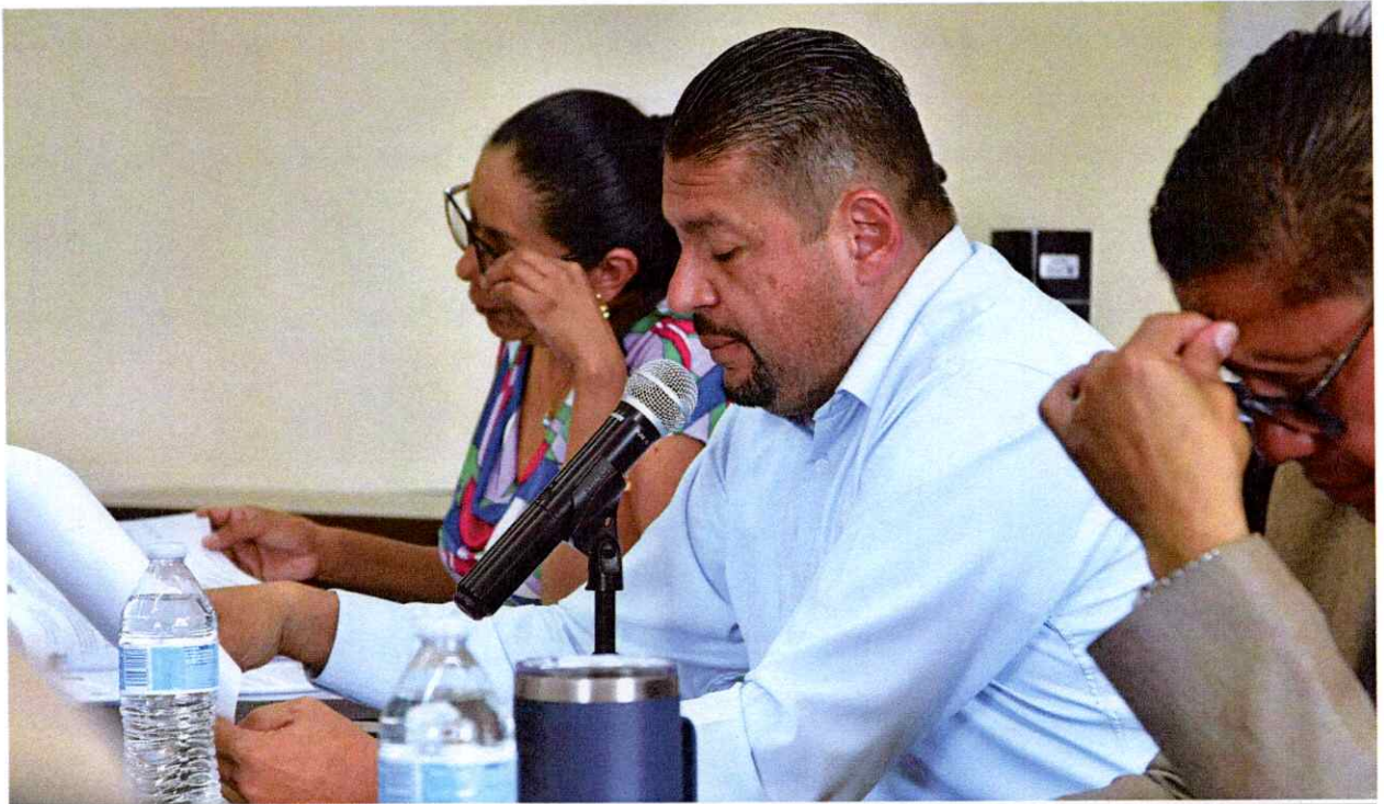
Sesión Extraordinaria No. 97.