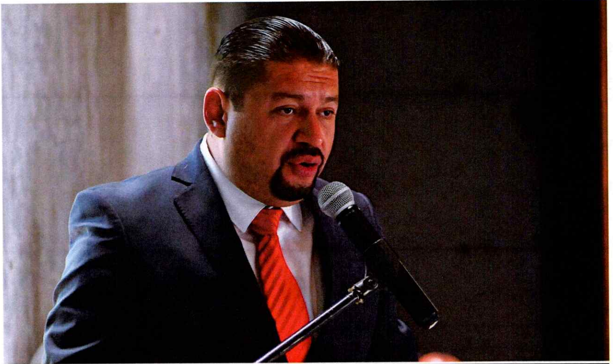
Sesión Solemne No. 38.