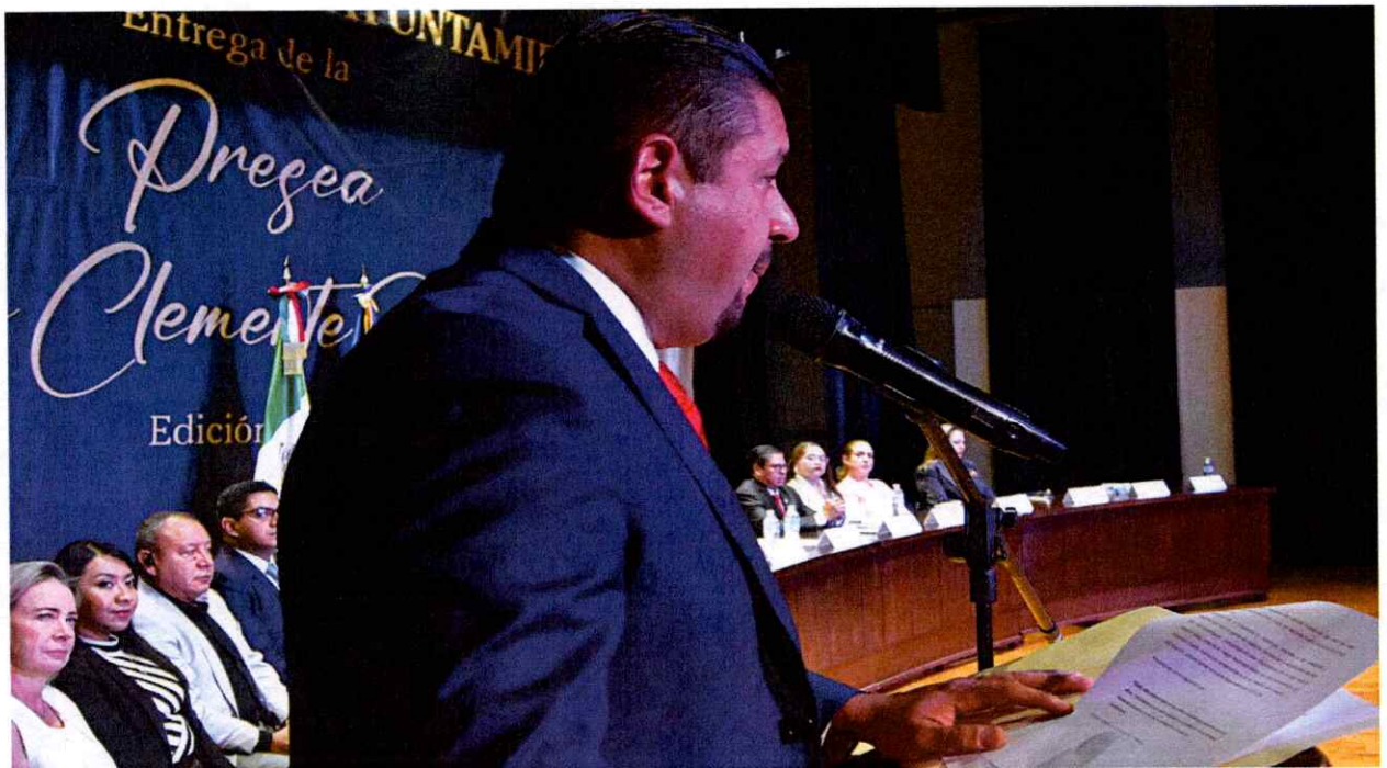
Sesión Solemne No. 37.