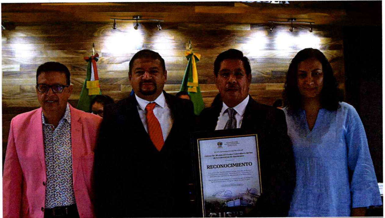
Sesión Solemne No. 38.

2024 Año del 85 Aniversario de la Escuela Secundaria Federal Benito Juárez