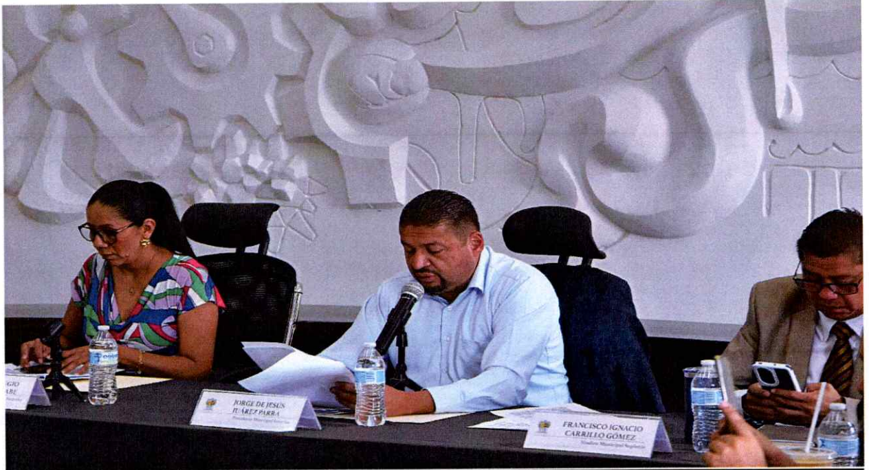
Sesión Extraordinaria No. 97.