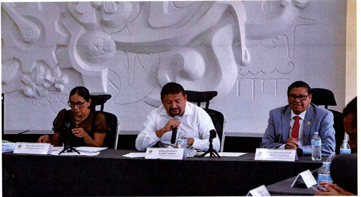
Sesión Ordinaria No. 51.