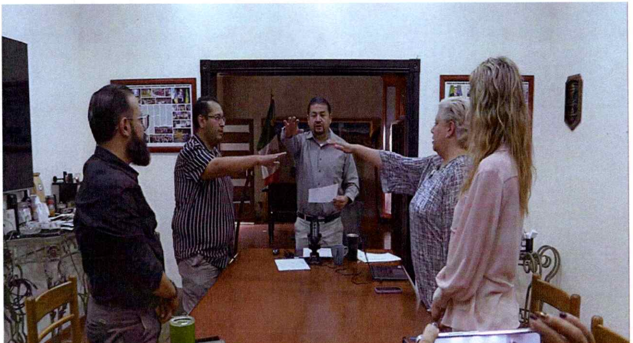
Sesión Extraordinaria de la Comisión Edilicia Permanente de Seguridad Pública y Prevención Social. Toma de Protesta.