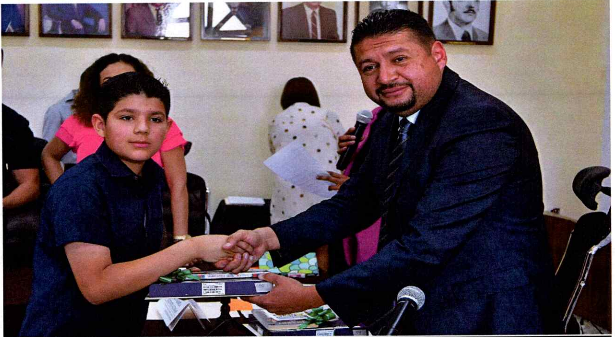
Sesión Extraordinaria No 94 .