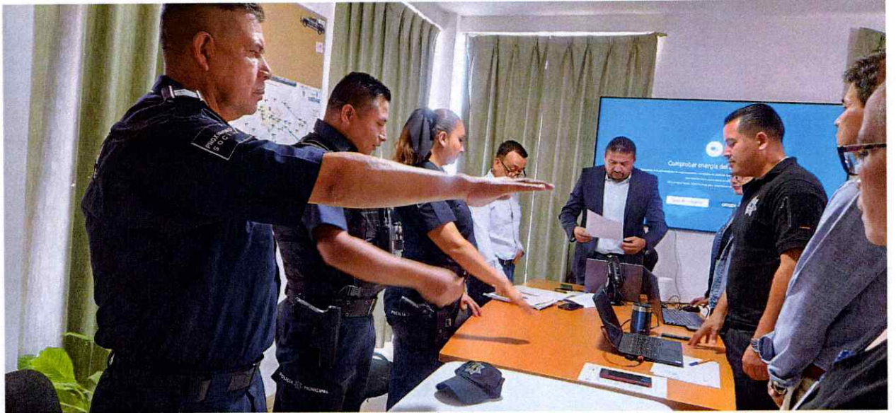
Toma de Protesta nuevos integrantes Consejo Municipal de Seguridad Pública, Honor y Justicia.