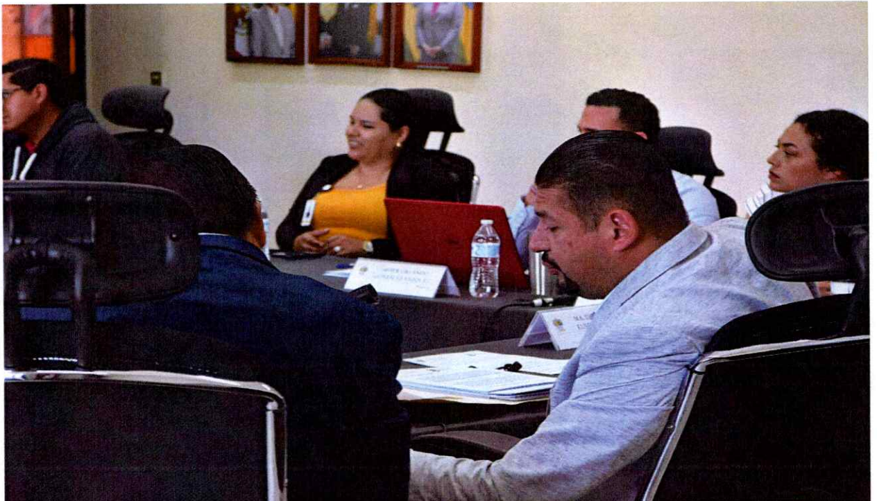
Sesión Ordinaria No. 50.