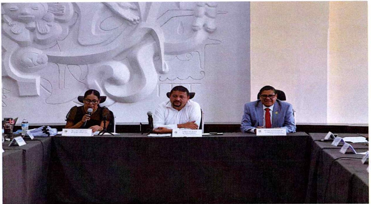
Sesión Ordinaria No. 51.