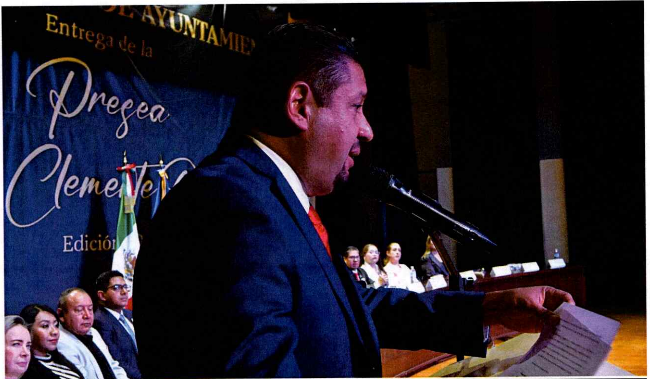
Sesión Solemne No. 37.