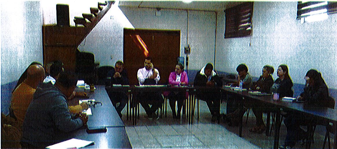
Sala Juan S. Vizcaíno, planta alta, Palacio de Gobierno Municipal.

En esta sesión se llevó a cabo el análisis de la propuesta para implementar la Campaña de Concientización "Mi Calle Limpia", contando con la participación de la Dirección de General de Servicios Públicos Municipales, Dirección de Imagen y Jefatura de Gestión de Residuos Sólidos.