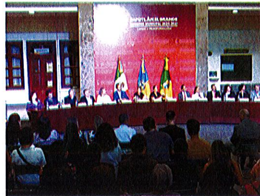
Patio del Palacio de Gobierno Municipal de Zapotlán El Grande, Jalisco.