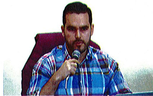
Sala de Ayuntamiento, planta alta de Palacio de Gobierno Municipal de Zapotlán El Grande, Jalisco.