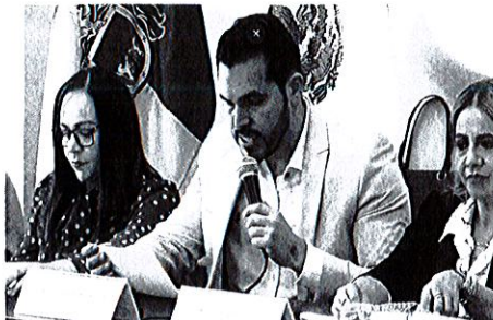
Sala de Ayuntamiento, planta alta de Palacio de Gobierno Municipal de Zapotlán El Grande, Jalisco.