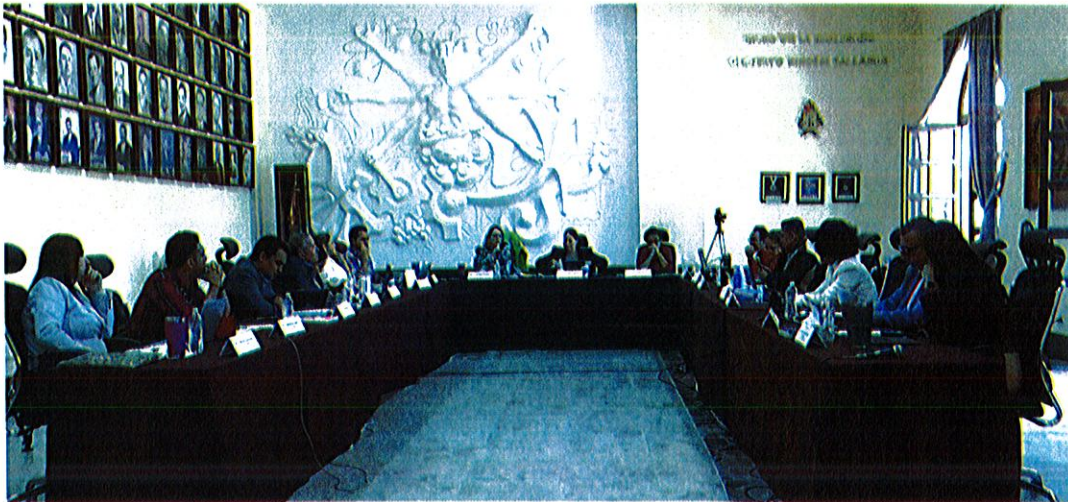
Sala de Ayuntamiento, planta alta de Palacio de Gobierno Municipal de Zapotlán El Grande, Jalisco.

Sesión Extraordinaria No. 56 del Ayuntamiento de Zapotlán El Grande, Jalisco.