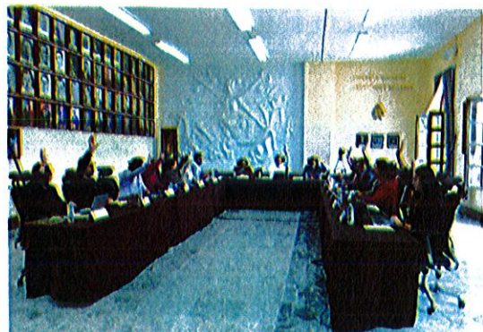
Sala de Ayuntamiento planta alta de Palacio de Gobierno Municipal de Zapotlán El Grande. Jalisco