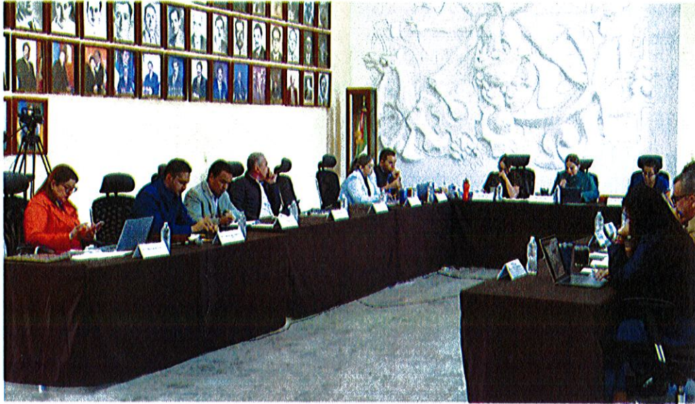
Sala de Ayuntamiento, planta alta de Palacio de Gobierno Municipal de Zapotlán El Grande, Jalisco.

Sesión Ordinaria No. 25 del Ayuntamiento de Zapotlán El Grande, Jalisco.