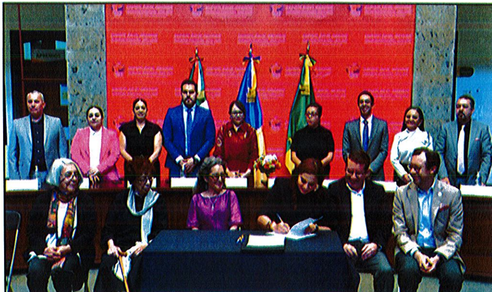
Patio central de Palacio de Gobierno Municipal de Zapotlán El Grande, Jalisco.

Con motivo de la Declaratoria de la Hija Adoptiva distinguida a la escritora Decimonónica Refugio Barragan de Toscano.