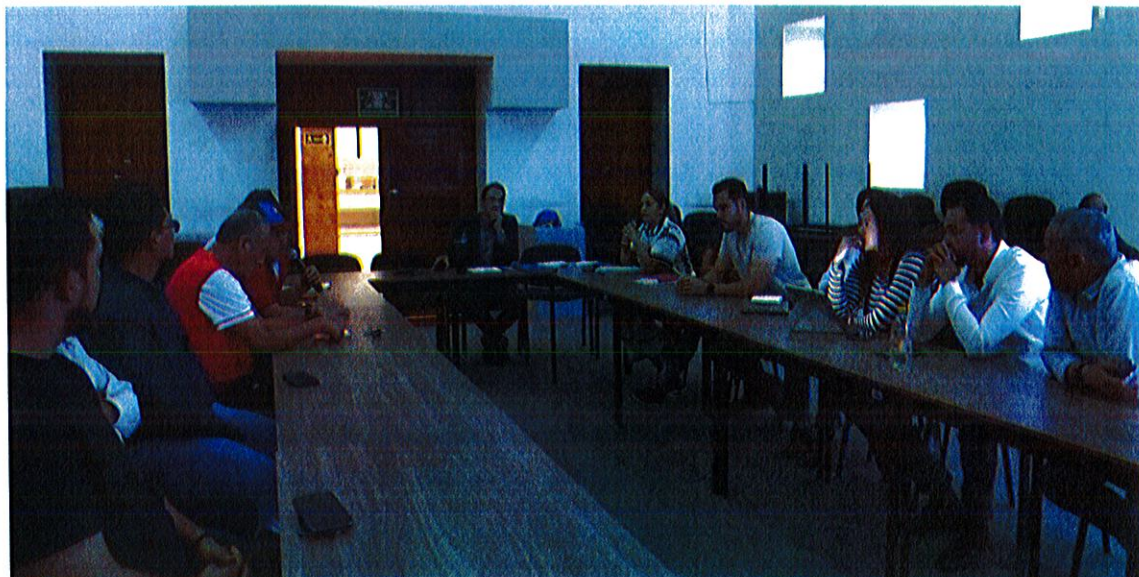
Sala Museográfica José Clemente Orozco, planta baja de Palacio de Gobierno Municipal.