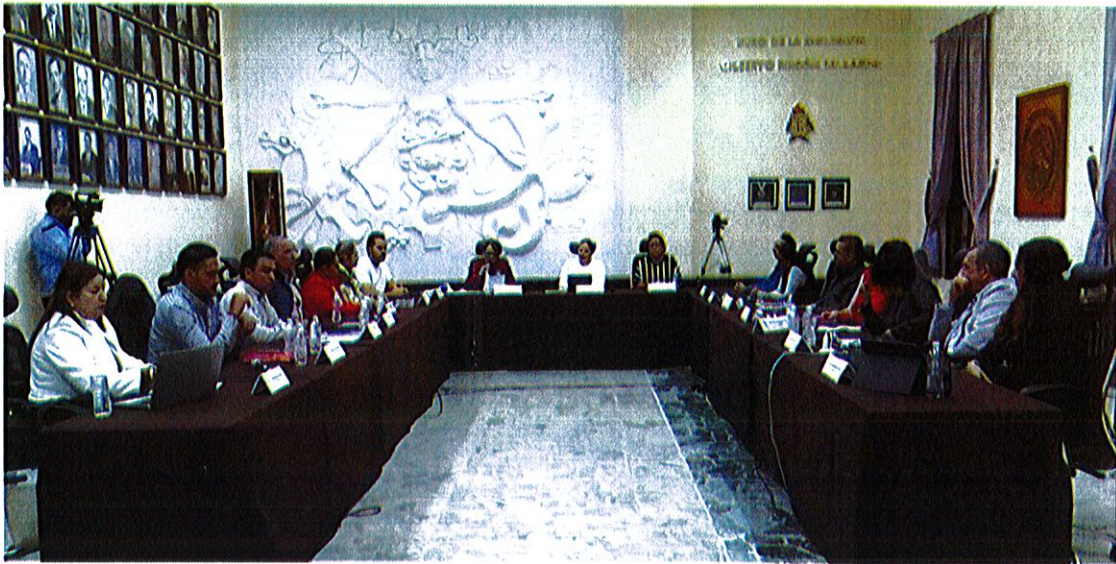
Sala de Ayuntamiento, planta alta de Palacio de Gobierno Municipal de Zapotlán El Grande, Jalisco.

Sesión Extraordinaria No. 54 del Ayuntamiento de Zapotlán El Grande, Jalisco.