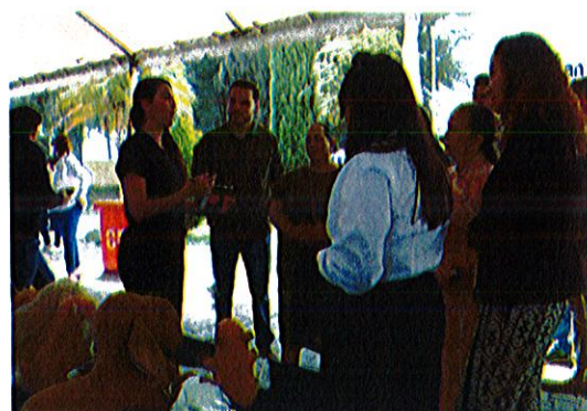
Explanada camino a C.A.S.A Centro Universitario del Sur. Av. Enrique Arreola Silva No. 833..