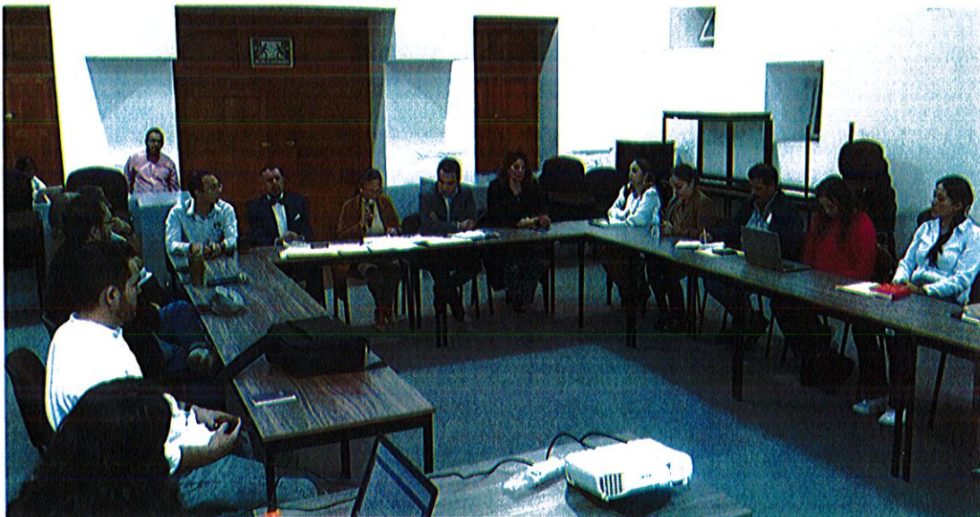
Sala Museográfica José Clemente Orozco, planta baja de Palacio de Gobierno Municipal.

Comisión Edilicia Permanente de Cultura, Educación y Festividades Cívicas. Sesión Ordinaria No. 20