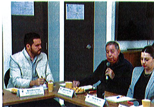
Salón Zapotlán, Hotel Uttsa Inn, Libramiento Periférico Sur No. 798, Ciudad Guzmán; Jalisco.