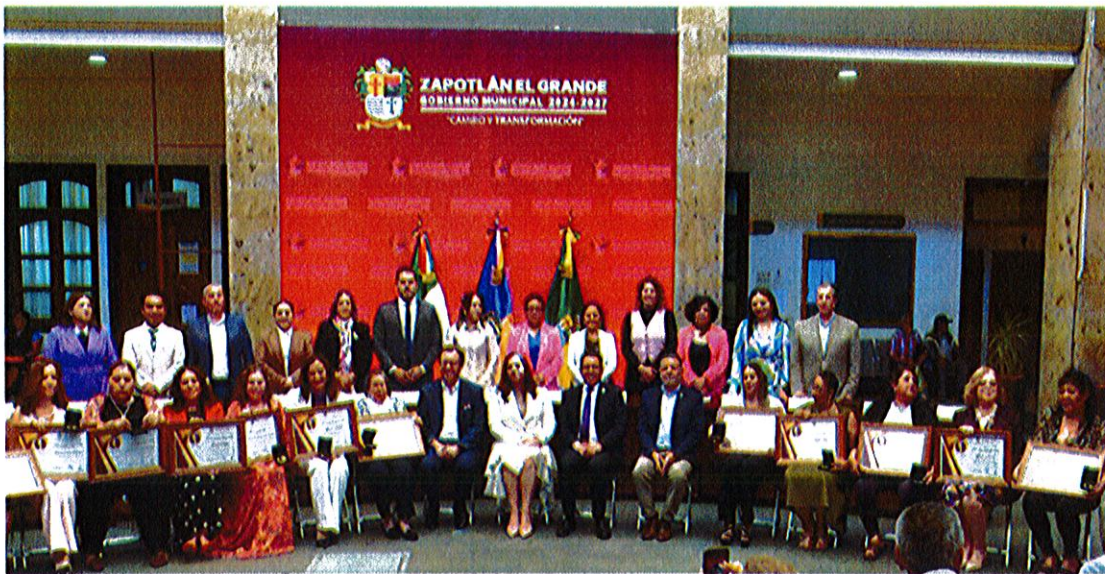
Sala de Ayuntamiento, planta alta de Palacio de Gobierno Municipal de Zapotlán El Grande, Jalisco

Con motivo de la Entrega de la Presea María Elena Larios González 2026, en el marco de los festejos del Día Internacional de la Mujer, se llevó a cabo sesión solemne para reconocer a las mujeres, colectivos y organizaciones de la sociedad civil que hayan destacado en la lucha por los derechos de las mujeres del Municipio.