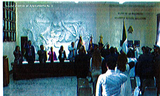
Sala de Ayuntamiento, planta alta de Palacio de Gobierno Municipal de Zapotlán El Grande, Jalisco.