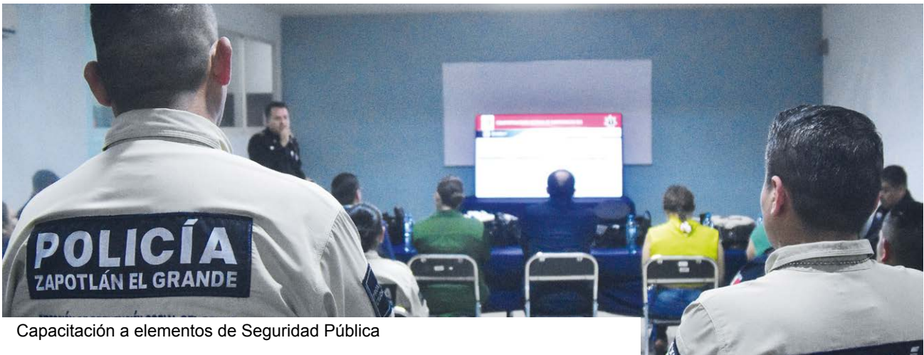
Capacitación a elementos de Seguridad Pública