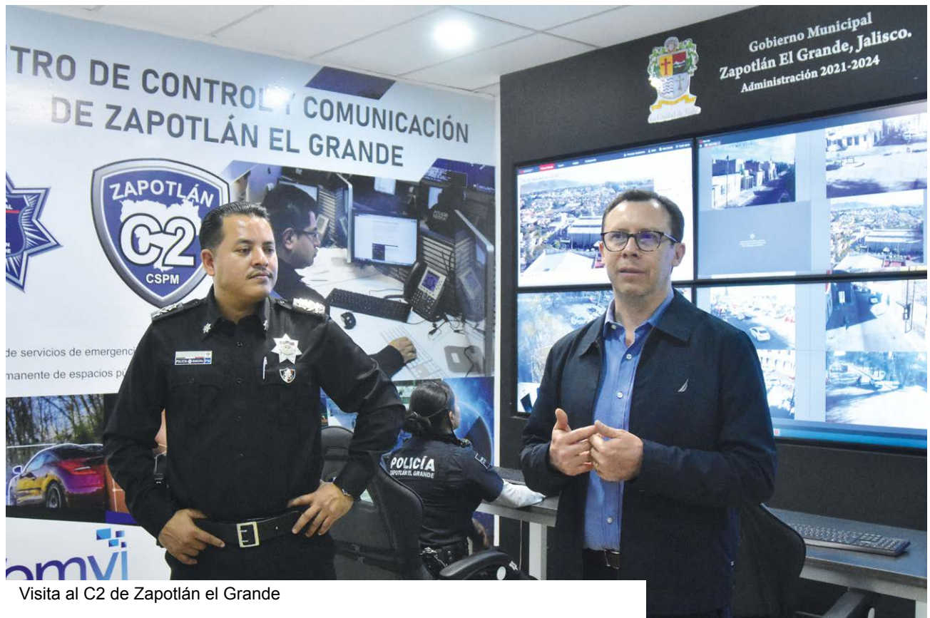
Visita al C2 de Zapotlán el Grande