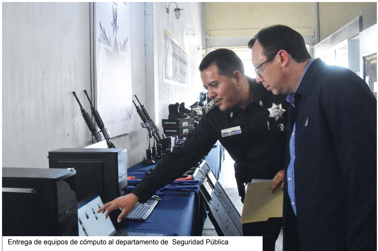
Entrega de equipos de cómputo al departamento de Seguridad Pública