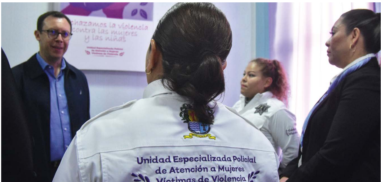
Visita a las instalaciones de la Unidad Especializada Policial de Atención a Mujeres Víctimas de Violencia