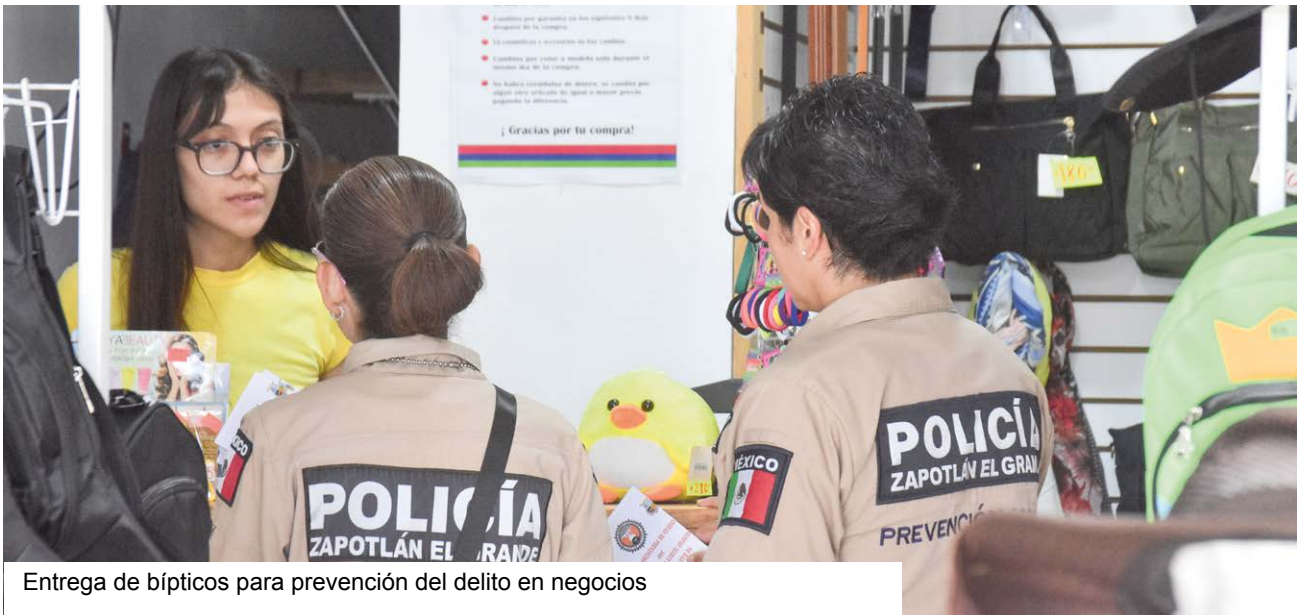
Entrega de bálticos para prevención del delito en negocios