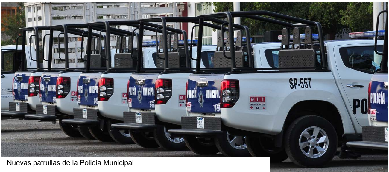
Nuevas patrullas de la Policía Municipal