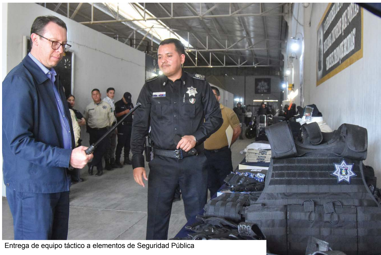
Entrega de equipo táctico a elementos de Seguridad Pública

Con la capacitación a empresas se han beneficiado un total de 1,425 trabajadores de 5 empresas entre ellas: Elektra, Coppel, Ayuntamiento, Escuela Normal, AVO ALSE, beneficiados con la capacitación "Detección de Delitos, Prevención de Violencia". Con estas acciones ayudamos a cuidar el patrimonio de empresas y al mismo tiempo el empleo de muchos ciudadanos que colaboran en ellas.