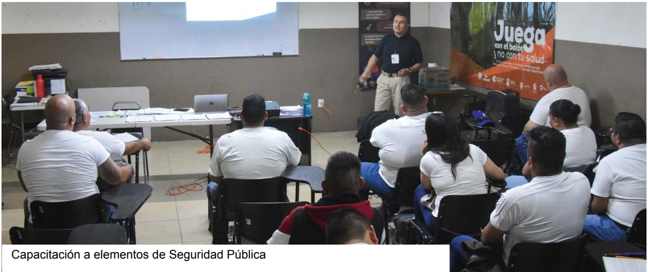
Capacitación a elementos de Seguridad Pública