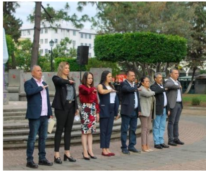
Lunes 16 202º ANIVERSARIO DE LA CREACIÓN DEL ESTADO LIBRE Y SOBERANO DEL ESTADO DE JALISCO (1823) Jardín 5 de mayo