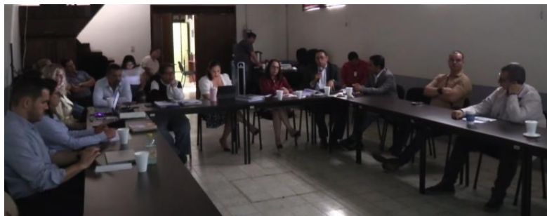
Martes 17 COMISION EDILICIA PERMANENTE DE CULTURA, EDUCACION Y FESTIVIDADES CIVICAS Sala Rocío Elizondo (Área de Regidores)