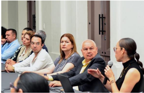
Miércoles 11 Consejo de Educación Escuela de Música Rubén Fuentes