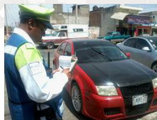
Imágenes de vialidad levantando requerimientos.